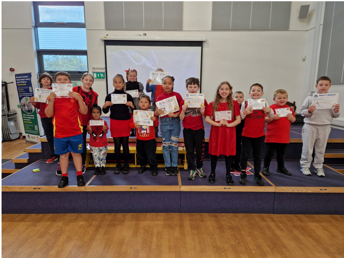
Enillwyr gwobrau yr Wythnos / Award winners of the week